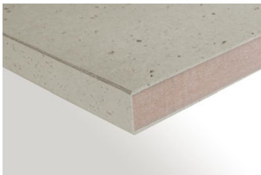
LightBeton ® : Querschnitt / Kante

Richter akustik & design GmbH & Co. KG St.-Annener-Straße 117 49326 Melle Telefon: +49 (0) 5428 9420-0 Telefax: +49 (0) 5428 9420-45 info@richter-akustik-design.de www.richter-akustik-design.de