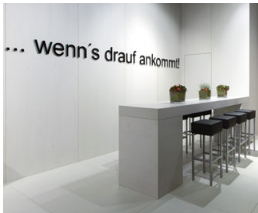
LightBeton im Messe- und Objektbau